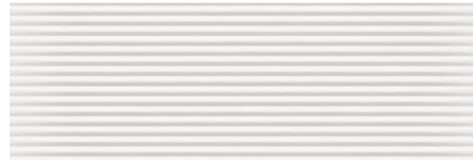
Milos Pulse Light