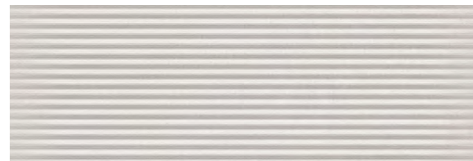
Milos Pulse Greige

Milos Pulse Greige 40x120 cm / 16"x48" RC ↘