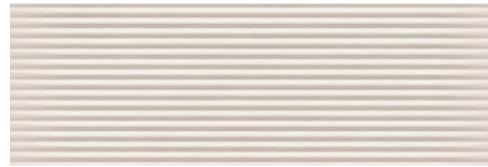
Milos Pulse Cream