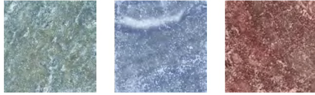
Nove Silva Nove Lyra Nove Brina