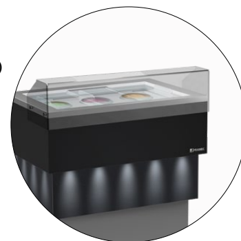
Alzata con piano di servizio in plexiglass Plexiglass stand with working top